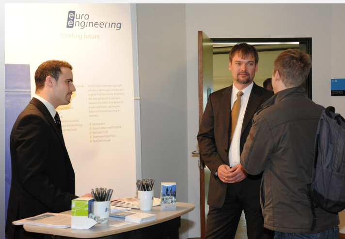
Für Firmen im Freundeskreis entfällt übrigens die Standgebühr an der Kontaktbörse

Studenten der Technikerschule profitieren von einem professionellen Bewerbungstraining , das ihnen in der beruflichen Zukunft dient.