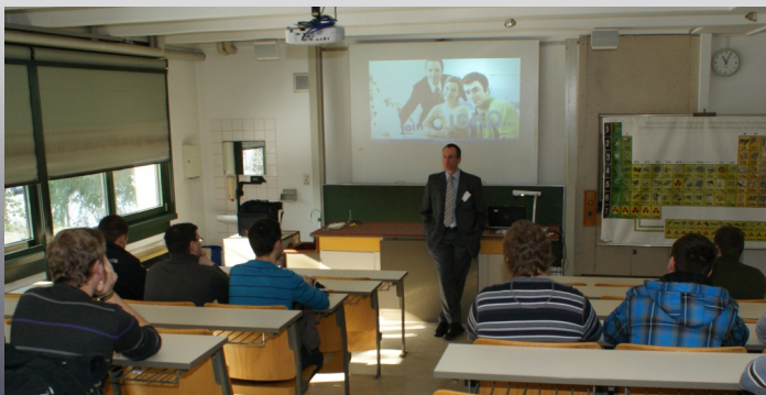
Vortrag Firmenpräsentation im Rahmen der Kontaktbörse