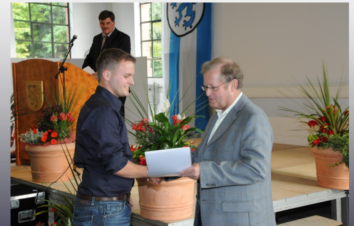
Preisverleihung Auszeichnung einer Projektarbeit bei der Abschlussfeier